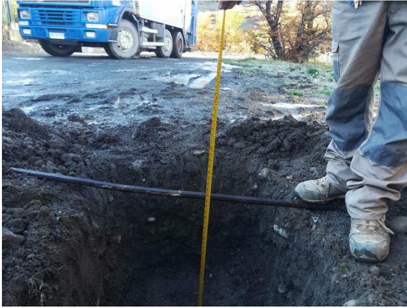
Figura 5. Calicata de 1 m aprox. En sitio adyacente al hecho constatado N°3. No se evidencio presencia de napa subterránea. El examen visual indicaría alto contenido de arenas, lo cual es consistente con los resultados de laboratorio efectuados por la empresa Terra Lab. El suelo se tanto de la calicata como del camino está húmedo producto de las lluvias ocurridas en el los días previos de realizar la calicata.