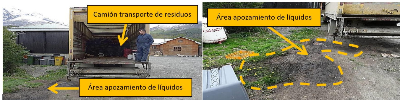
Figura 1. Fotografías tomadas por el fiscalizador de la SMA. Izquierda: vista general del apozamiento en el suelo en sector de Acopio y derecha: Vista en detalle de zona del apozamiento que el inspector constato. Nótese la presencia de vegetación en el mismo lugar del hecho constatado a orilla del camino.

A continuación se muestra dos fotografías que el inspector tomo en el lugar: